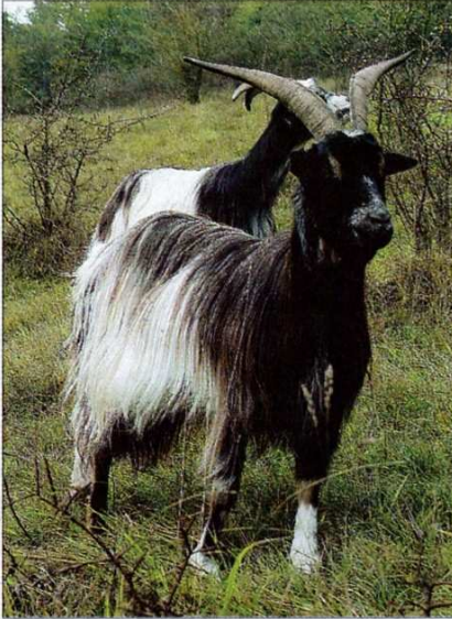
■ Le bouc des fossés coule des jours heureux sur le coteau de la Bandonnière.

La chèvre commune de l'Ouest parfois dite chèvre des talus ou plus souvent chèvre des fossés est une population caprine relique. Elle vivait dans les provinces normandes et bretonnes ainsi que dans les Pays de la Loire.