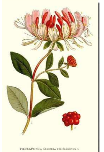
VILDKAPRIFOL, LONICERA PERICLYMENUM L.

L'on dit que la chèvre aime le chèvrefeuille, mais elle aime plus de 460 plantes !